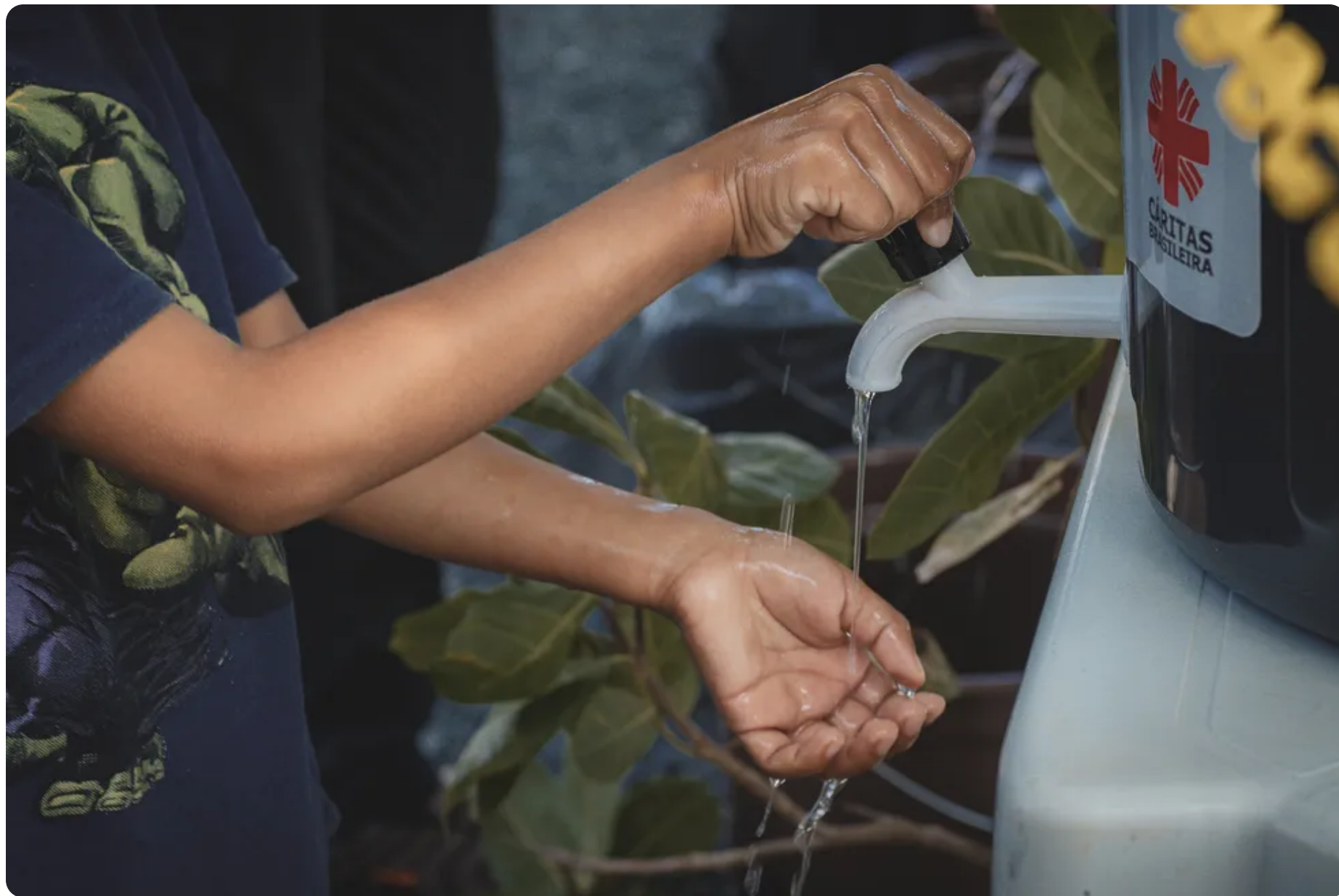
Orinoco desenvolve ações de acesso a água, saneamento e higiene.