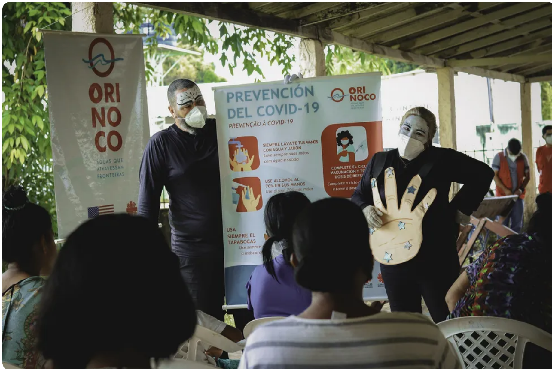
Ações sobre a prevenção contra a Covid-19.