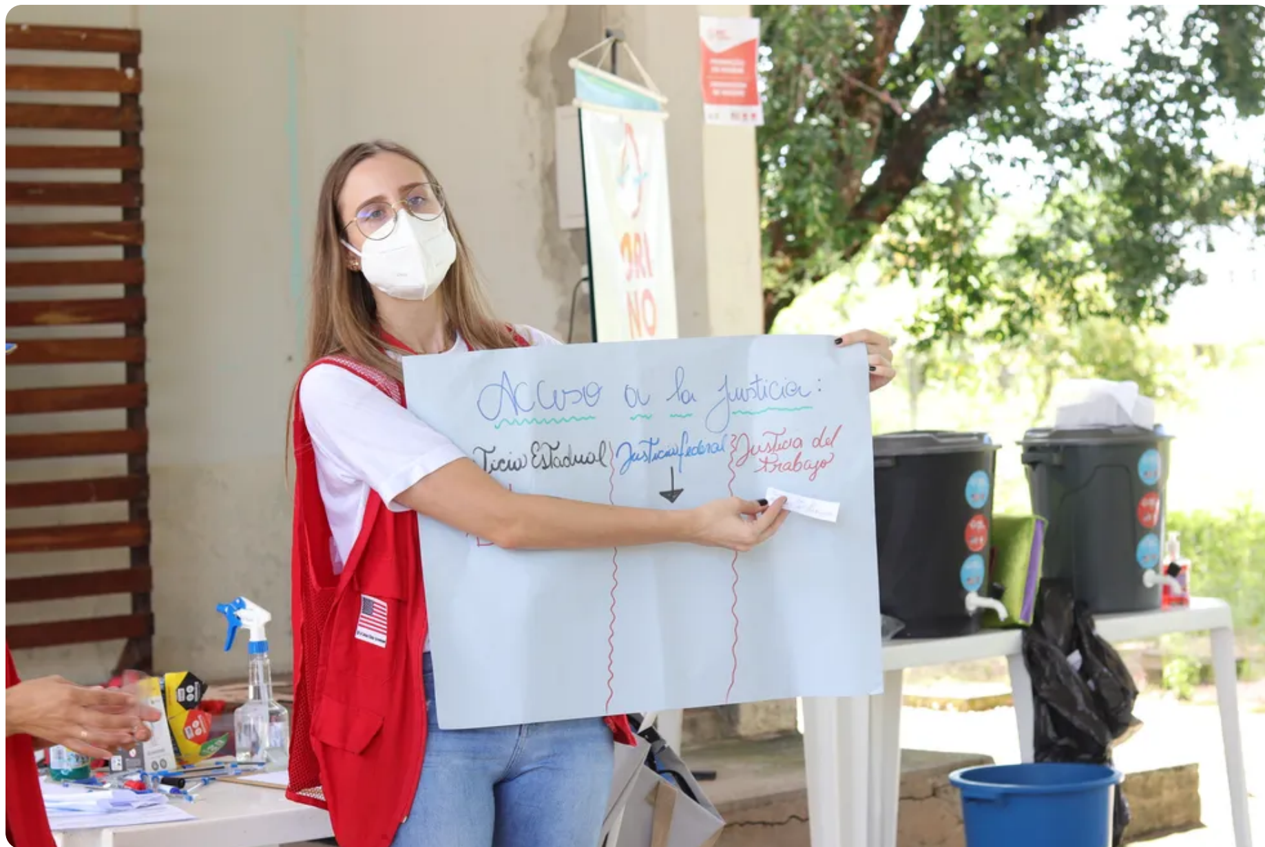
Orinoco também desenvolve ações de acesso a direitos.

Segundo a Cáritas, dentre a população migrante e refugiada venezuelana, "há um importante contingente de